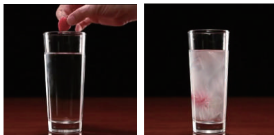
液体状態のドリンクにイチゴを落とすと、一瞬にして凍り出す。

Tokyo Snowman では、凍るきっかけを取り除き、成功率の高い過冷却飲料を作ることができます。