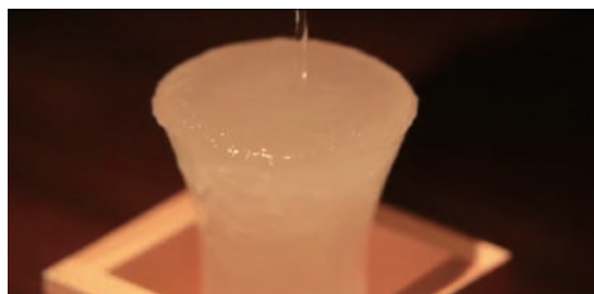
フローズン冷酒も手軽に実現できます。

Tokyo Snowman で冷やしたドリンクによる驚きと楽しさのパフォーマンスは、飲食店・パーティーなどにも最適。ドリンクの提供時に、今までにない感動を。